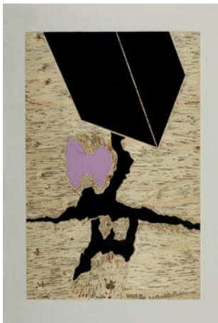
Camiel Andriessen, houtplaat (2007)

De tentoonstelling is te zien van 30 oktober tot en met 27 december 2008.