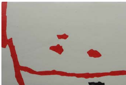
Cees Andriessen, z.t. houtsnede (2008)