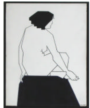
Hendrik Valk, 'Naaktstudie' (1965), olieverf op masonite, 42x32 cm